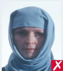
shadows across face