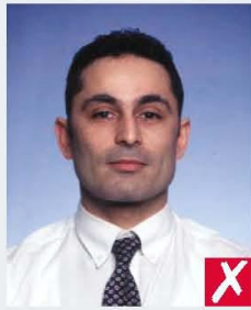
too far away