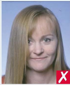
hair across eyes