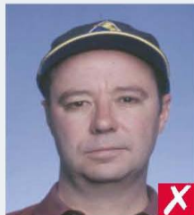
wearing a cap