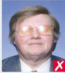
flash reflection on lenses