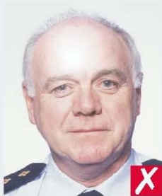
flash reflection on skin