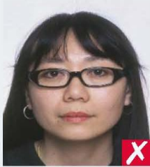
frames too heavy