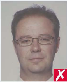
washed out colour