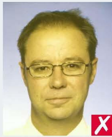
unnatural skin tones