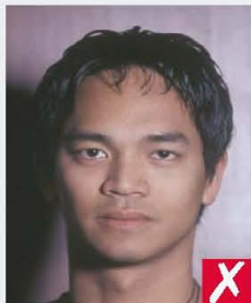
shadows behind head