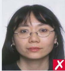
frames covering eyes