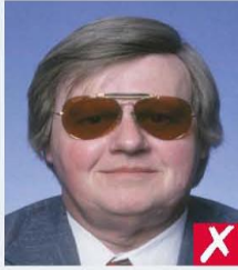
dark tinted lenses