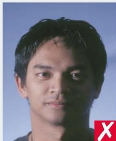
shadows across face