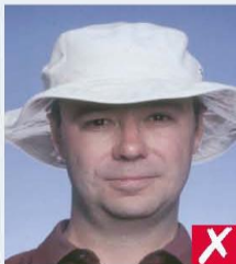
wearing a hat