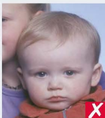
shows another person