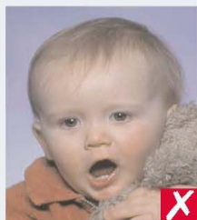
mouth open and toy too close to face