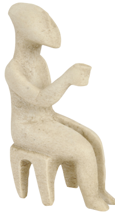
Αντίγραφο ανδρικού ειδωλίου που κάθεται σε σκαμνί και κρατά ποτήρι.