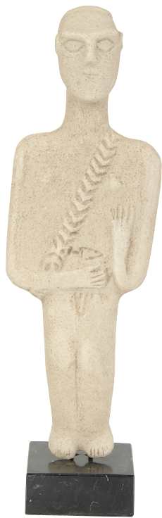
Αντίγραφο ειδωλίου ανδρικής μορφής που απεικονίζει κυνηγό.