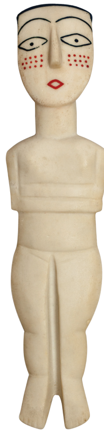
Αντίγραφο ειδωλίου γυναικείας μορφής με διπλωμένα χέρια και ζωγραφισμένες λεπτομέρειες.