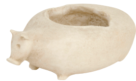
Αντίγραφο ζώομορφης πυξίδας (κουτάκι για κοσμήματα).