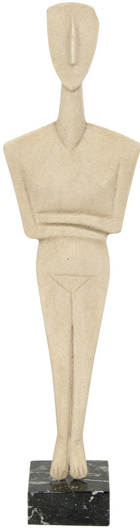
Αντίγραφο ειδωλίου γυναικείας μορφής με διπλωμένα χέρια.