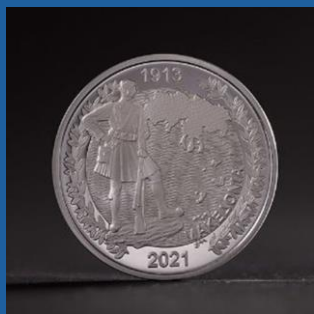
1913 - Η ενσωμάτωση της Μακεδονίας 200 € έκαστο