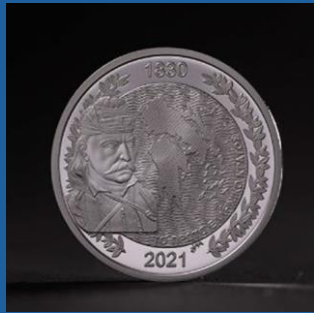
1830 - Το Πρώτο Ελληνικό Κράτος 200 € έκαστο