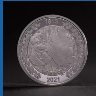
1913 - Η ενσωμάτωση της Ηπείρου 200 € έκαστο