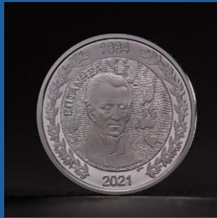
1864 - Η ενσωμάτωση των Επτανήσων 200 € έκαστο