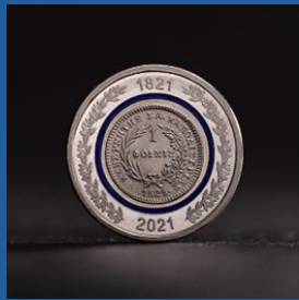
Ο Φοίνικας του 1828 40 € έκαστο