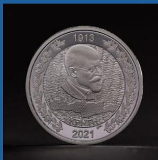
1913 - Η ενσωμάτωση της Κρήτης 200 € έκαστο