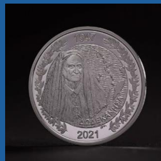
1947 - Η ενσωμάτωση της Δωδεκανήσου 200 € έκαστο