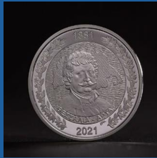
1881 - Η ενσωμάτωση της Θεσσαλίας και μέρους της Ηπείρου (Αρτα) 200 € έκαστο