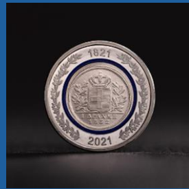
Η Δραχμή του 1832 40 € έκαστο