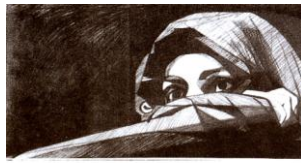
MARIA CALLAS GRAND PRIX