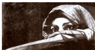
MARIA CALLAS GRAND PRIX