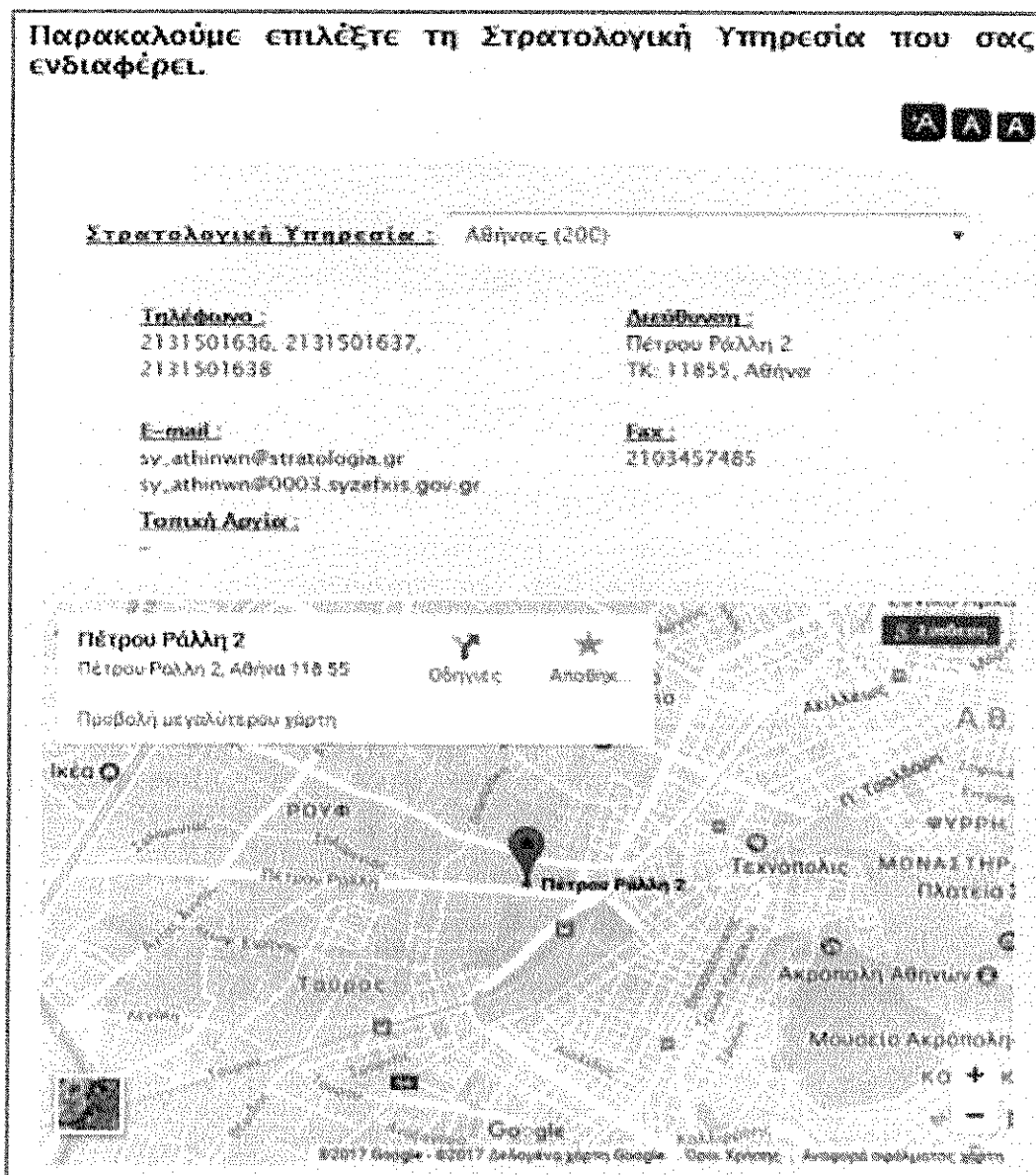
Εικόνα 12: Στοιχεία Επικοινωνίας

Για εσφαλμένα ληξιαρχικά στοιχεία, μη ανεύρεση απογραφόμενου και ερωτήσεις στρατολογικής φύσης παρακαλούμε να απευθύνεστε στις καθ' ύλην αρμόδιες Στρατολογικές Υπηρεσίες. (Τηλέφωνα επικοινωνίας μπορείτε να βρείτε στον ιστότοπο της Διεύθυνσης Νομικού Σώματος ( www.stratologia.gr ), είτε επιλέγοντας «Επικοινωνία» (Εικόνα 2), είτε απευθείας στο σύνδεσμο www.stratologia.gr/el/epikoinwnia ) (βλ. παρακάτω εικόνα 12):