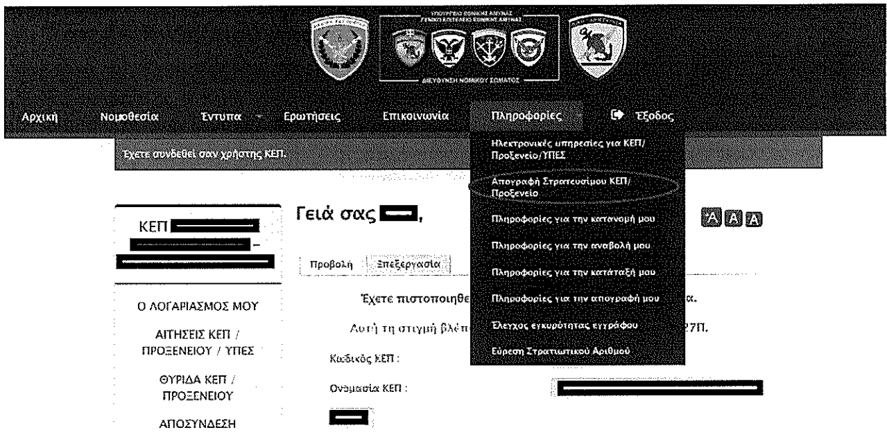
Εικόνα 2: Αρχική οθόνη