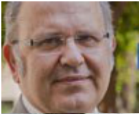
Αναπληρωτής υπουργός Πολιτισμού: Νίκος Ευδάκης