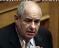
Υφυπουργός: Τέρενς Κουίκ