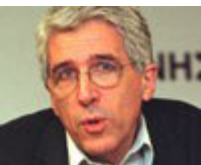
Υπουργός: Νίκος Παρασκευόπουλος