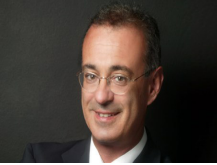
-Αναπληρωτής υπουργός για τα έσοδα Δ. Μάρδας