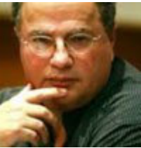
Υπουργός: Νίκος Κοτζιάς