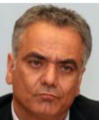
Υπουργός: Πάνος Σκουρλέτης