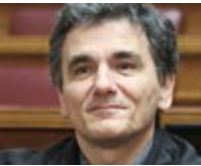
Αναπληρωτής υπουργός διεθνών σχέσεων: Ευκλείδης Τσακαλώτος