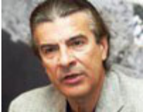
Αναπληρωτής υπουργός Παιδείας: Τάσος Κουράκης