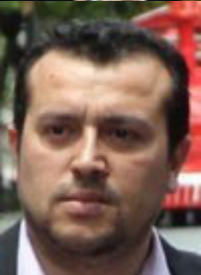
Υπουργός Επικρατείας: Νίκος Παπάς