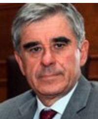
Υπουργός Επικρατείας για την καταπολέμηση της Διαφθοράς: Παναγιώτης Νικολούδης