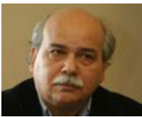
Υπουργός: Νίκος Βούτσας