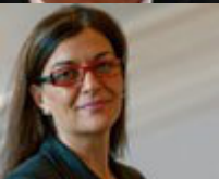
Αναπληρωτής υπουργός: Ράνια Αντωνοπούλου