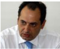
Αναπληρωτής υπουργός Υποδομών, Μεταφορών και Δικτύων: Χρ. Σπίρτζης