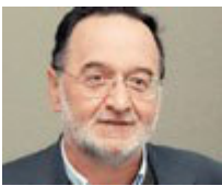
Υπουργός: Παναγιώτης Λαφαζάνης