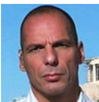
Υπουργός Οικονομικών: Γιάννης Βαρουφάκης