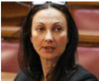
Αναπληρωτής υπουργός Τουρισμού: Κουντουρά Ελένη