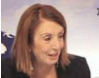
Αναπληρωτής υπουργός Μετανάστευσης Τασία Χριστοδουλοπούλου