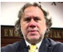
Αναπληρωτής υπουργός Διοικητικής Μεταρρύθμισης και Ηλεκτρονικής Διακυβέρνησης: Γ. Κατρούγκαλος