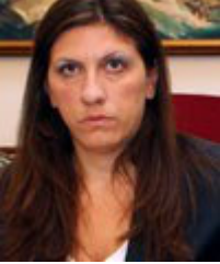
Πρόεδρος Βουλής: Θα προταθεί η Ζωή Κωνσταντοπούλου