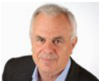
Αναπληρωτής υπουργός Αγροτικής Ανάπτυξης και Τροφίμων: Βαγγέλης Αποστόλου