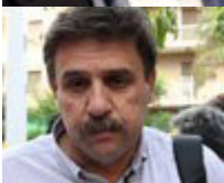
Αναπληρωτής υπουργός: Ανδρέας Ξανθός