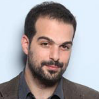
Υφυπουργός παρά τω πρωθυπουργώ και Κυβερνητικός Εκπρόσωπος: Γαβριήλ Σακελλαρίδης