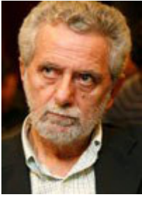
Αναπληρωτής υπουργός Ναυτιλίας και Αιγαίου: Θεόδωρος Δρίτσας