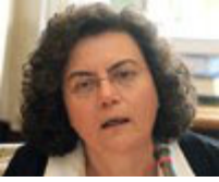
-Αναπληρωτής υπουργός: Νάντια Βαλαβάνη