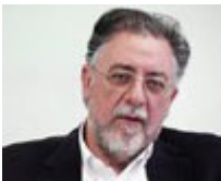
Αναπληρωτής υπουργός Δημόσιας Τάξης και Προστασίας του Πολίτη: Γιάννης Πανούσης