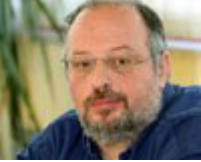
Αναπληρωτής υπουργός: Κώστας Ήσιχος