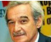
Αναπληρωτής υπουργός Ευρωπαϊκών Υποθέσεων Νίκος Χουντής