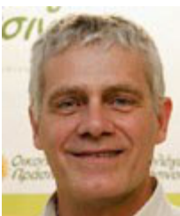
Αναπληρωτής υπουργός Περιβάλλοντος και Ενέργειας: Γιάννης Τσιρώνης