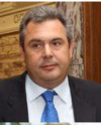
Υπουργός: Παναγιώτης Καμμένος