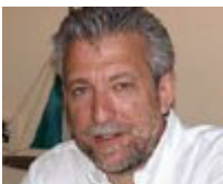
Υφυπουργός Αθλητισμού: Σταύρος Κοντονής