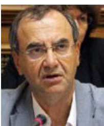
Αναπληρωτής υπουργός Κοινωνικής Ασφάλισης: Δημήτρης Στρατούλης