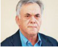
Αντιπρόεδρος της κυβέρνησης: Γιάννης Δραγασάκης