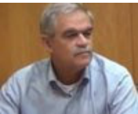
Υφυπουργός Νίκος Τόσκας