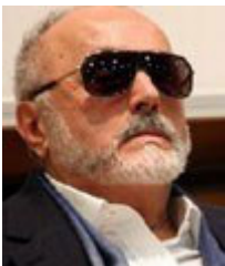
Υπουργός: Παναγιώτης Κουρουμπλής