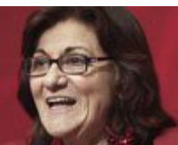
Αναπληρωτής υπουργός: Θεανώ Φωτίου