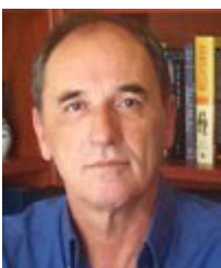
Υπουργός: Γιώργος Σταθάκης