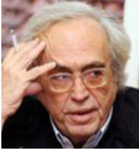
Υπουργός Αριστείδης Μπαλτάς